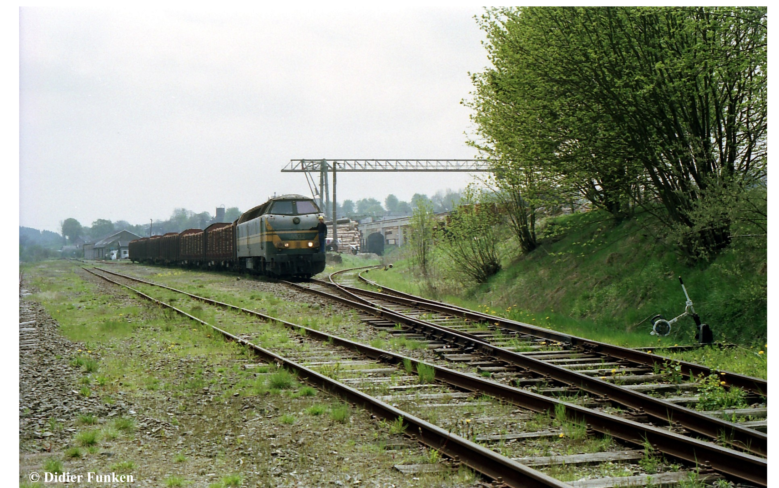
Bis 2006 fuhren noch Holzzüge (Aufn.: Mai 1991).

Sinds 2002 spoort geen passagierstrein meer over het Belgische deeltraject; vanaf einde 2003 kwamen over de lijn geen houttransporten meer; de zagerij Pauls werd wel nog tot 2006 beleverd via Trois-Ponts. Februari 2004 werd alle verkeer tussen Weywertz en Büllingen opgeheven. Nadat de treinsporen in 2006-2007 werden opgebroken, konden wandelaars en fietsers, vanaf de zomer 2012, de voormalige spoorlijn in gebruik nemen.