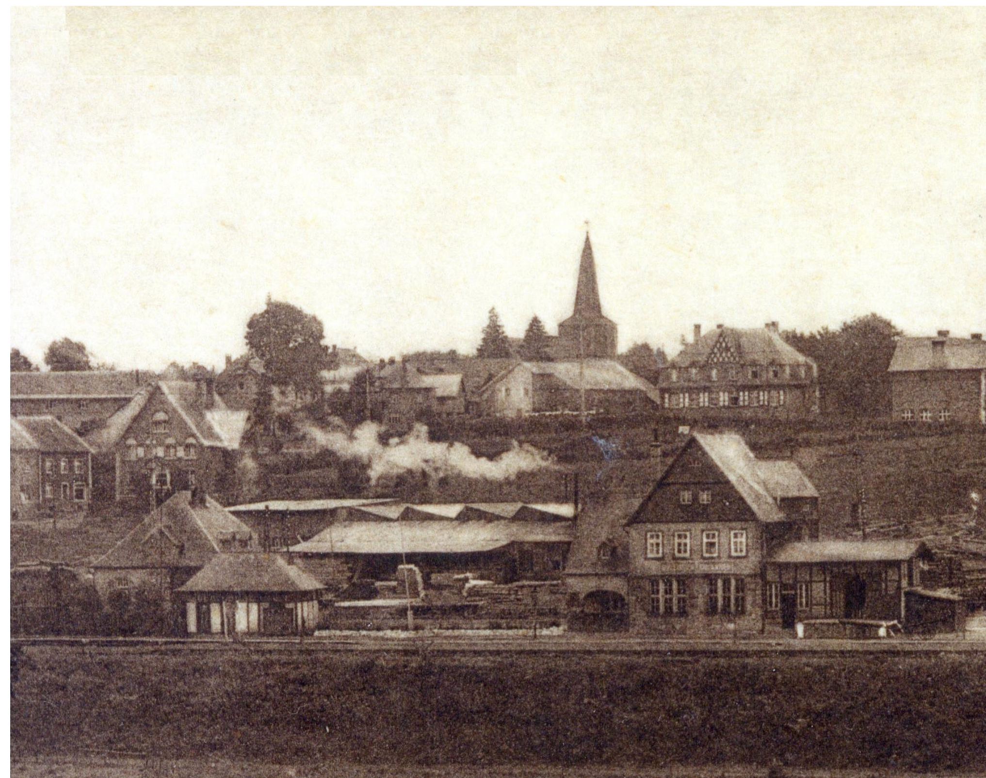
Die Eisenbahn bringt Wirtschaftswachstum (um 1930).

Les rails furent enlevés en 2006-2007 et depuis l'été 2012, l'assise de l'ancienne ligne ferroviaire est ouverte aux cyclistes et aux promeneurs.