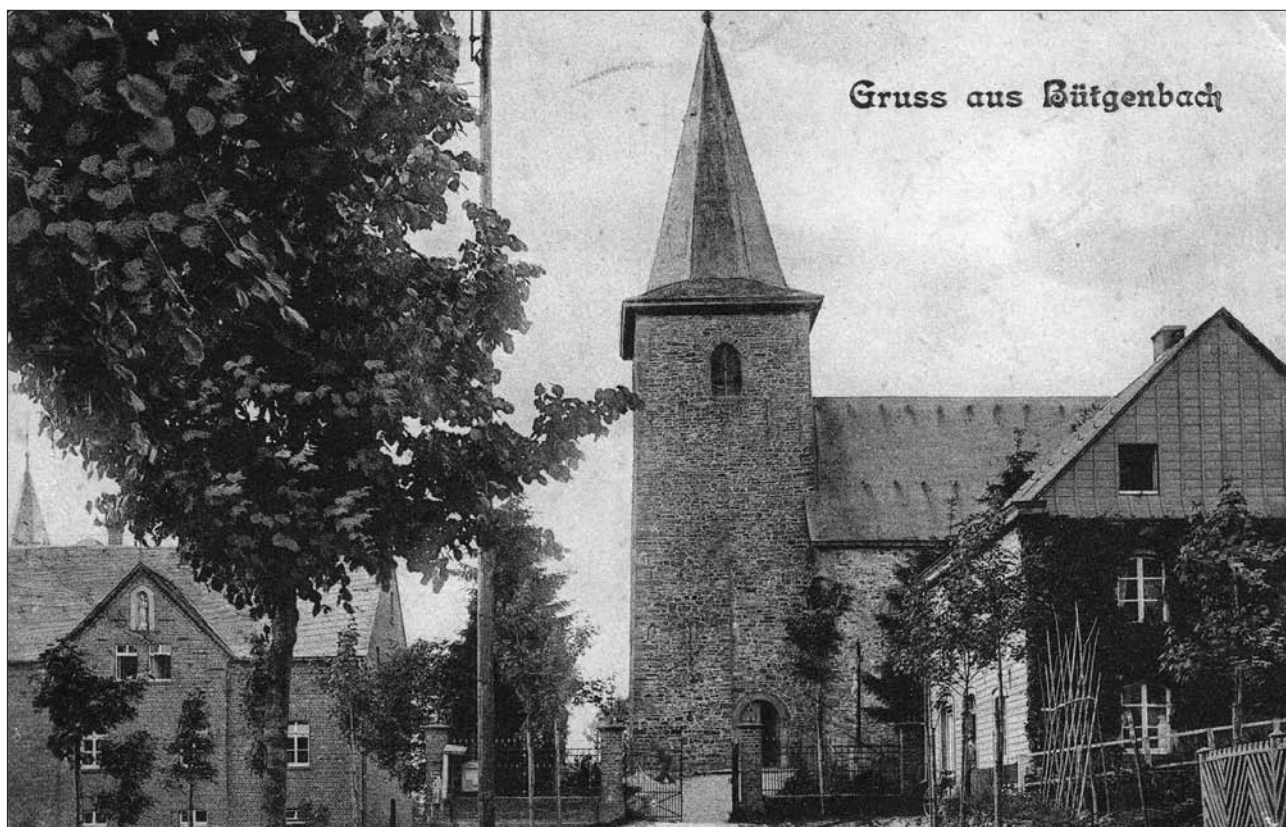
Die Gendarmeriebrigade war im alten Pfarrhaus (rechts) untergebracht. Postkarte, 1904 gestempelt.

(Sammlung Kurt Andres, http://ansichtskarten.110mb.com )