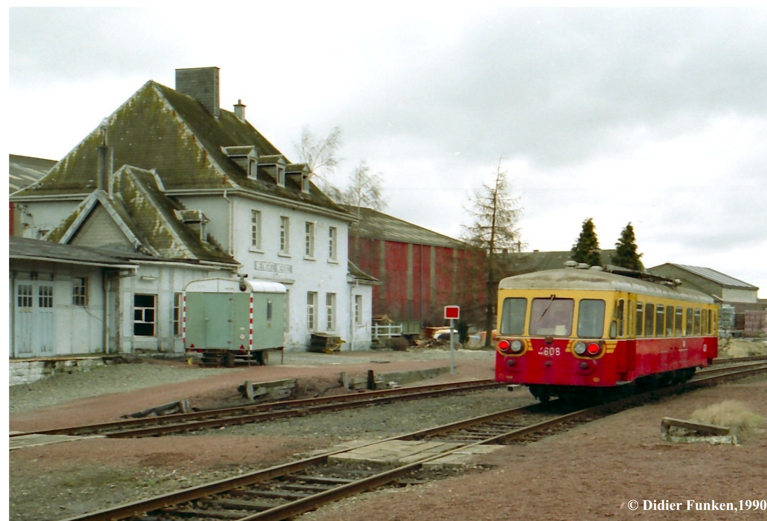
Ein Schienenbus („Trottinette“) im Bahnhof Weywertz (1990). Autorail (« trottinette ») à la gare de Weywertz (1990). aduct over de Warche (ca 1925).