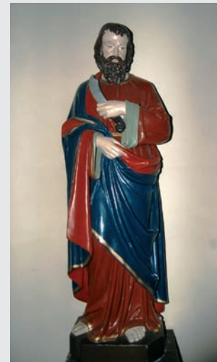
Bartholomäus, Pfarrpatron von Elsenborn. In früheren Zeiten wurden viele Kinder nach ihm benannt.

Hier einige Beispiele von alten christlichen Taufnamen aus Elsenborn. Ausgehend von den Kurzformen sind viele unserer Hausnamen entstanden: