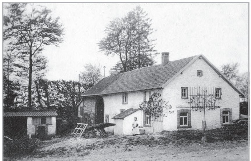
Haus Lüesch um 1900. Hundert Jahre früher war hier eine Gerberei. Den Hausnamen Lüesch verdanken wir den Löhern oder Lohgerbern, die hier wohnten und arbeiteten. Aus den Häuten von Rindern und Pferden stellten sie robustes Leder her, wobei sie die Eichenlohe als Gerbstoff verwendeten.